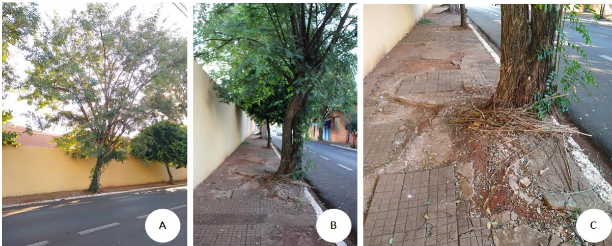
Figura 4: Indivíduo 4 de Tipuana tipu . A. Vista geral da árvore. B. Detalhe do espaço disponível inadequado e do calçamento.