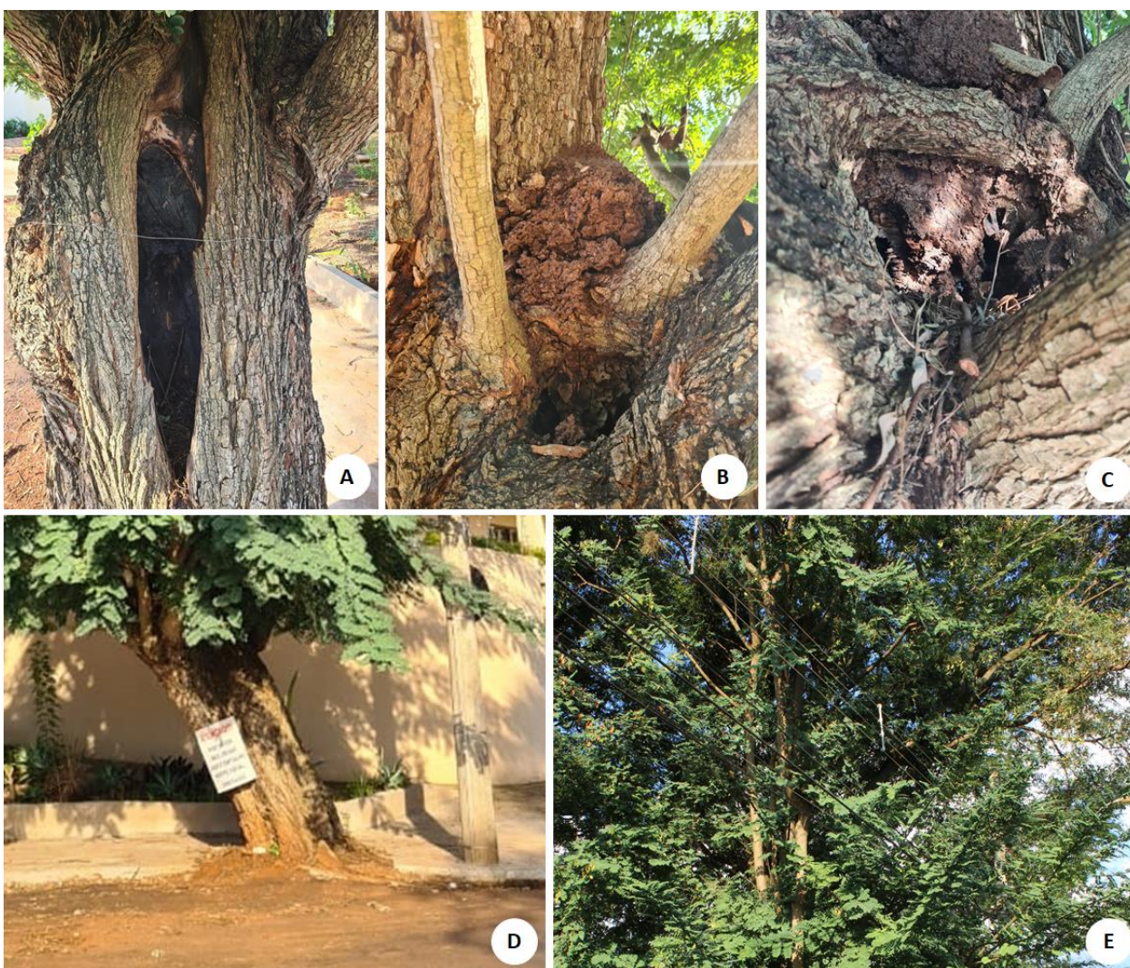
Figura 2: Problemas fitossanitários. A. Oco no tronco. B-C. Cupins e danos no caule. D. Espaço inadequado para a espécie. E. Problemas com a fiação.

4) Devido ao porte elevado do indivíduo, a fiação elétrica está passando no meio de sua copa, o que pode ocasionar problemas (Figura 2E).