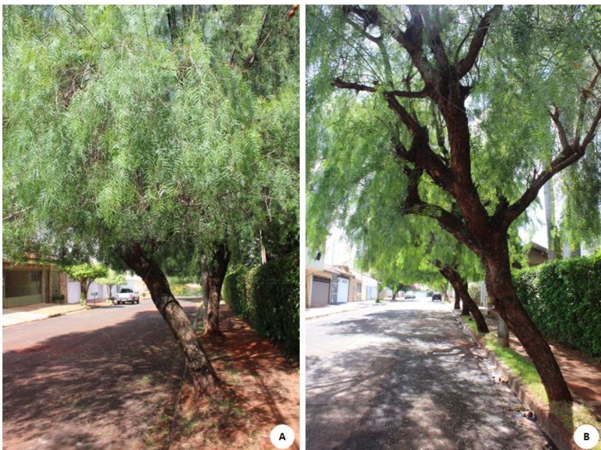
Figura 1. Schinus molle . A. Árvore inclinada para a rua. B. Indivíduos inclinados para rua e espaço de canteiro inadequado para a espécie.

2) A maioria dos indivíduos apresenta problemas fitossanitários tais como: oco no tronco (Figura 2A) e cupins (Figura 2B), o que pode indicar a existência de danos na sua estrutura interna, comprometendo sua estabilidade.